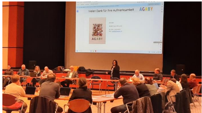
AGABY beim Stadtrat in Zirndorf am 16.04.2024

Auf Einladung des Stadtrates in Zirndorf informierte AGABY in einer Sitzung über das Konzept der Integrationsbeiräte und welche Schritte bei einer Gründung empfohlen werden.