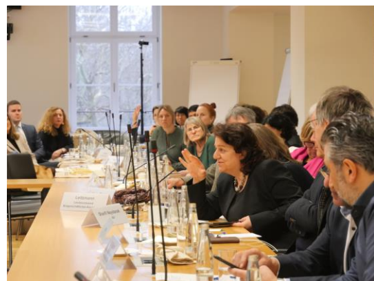
Sitzung Bayerischer Integrationsrat

AGABY ist mit Fachexpertise als Mitglied in zahlreichen Gremien und in Netzwerken und Bündnissen aktiv (-> Übersicht Website ): Bayerischer Integrationsrat, Wertebündnis Bayern, Bayerisches Bündnis für Toleranz – Demokratie und Menschenwürde schützen, Rundfunk- und Medienrat, Islamforum, Netzwerk Rassismus- und Diskriminierungsfreies Bayern, Landesnetzwerk Bürgerschaftliches Engagement (LBE), Forum Bildungspolitik in Bayern u.v.m.