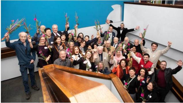
Jubiläumsfeier 50 Jahre AIB Erlangen

30-jähriges Jubiläum feierten der Migrantinnen- und Migrantenbeirat Bamberg und der Integrationsbeirat Ansbach.