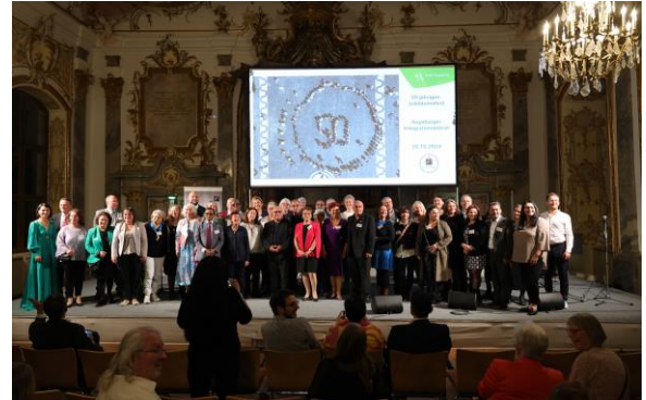
Jubiläumsfeier 50 Jahre IB Augsburg