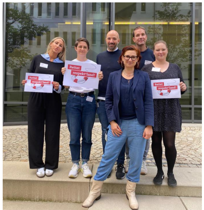
Die Projektkoordinator*innen der bayerischen respekt*land Projekte mit Ferda Ataman am 19.09.2024 in Berlin

Die Beratungsarbeit profitiert sehr von dieser breiten Vernetzung und der engen Zusammenarbeit aller respekt*land Projekte in Bayern.